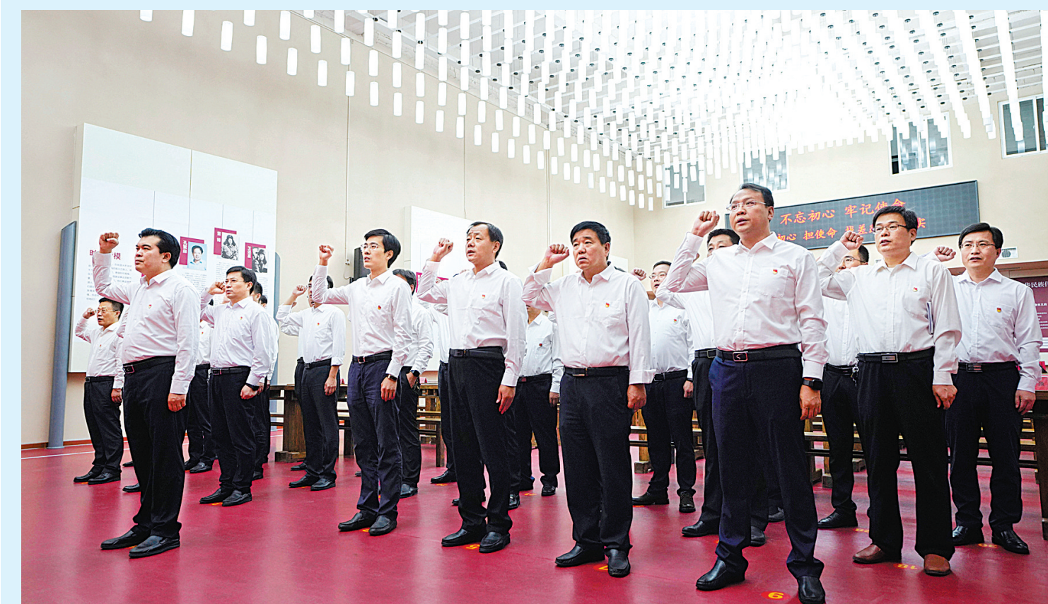
中共河北省清河县委理论学习中心组开展“不忘初心、牢记使命”主题教育集中学习。这是党员干部重温入党誓词(2019年9月17日摄)。