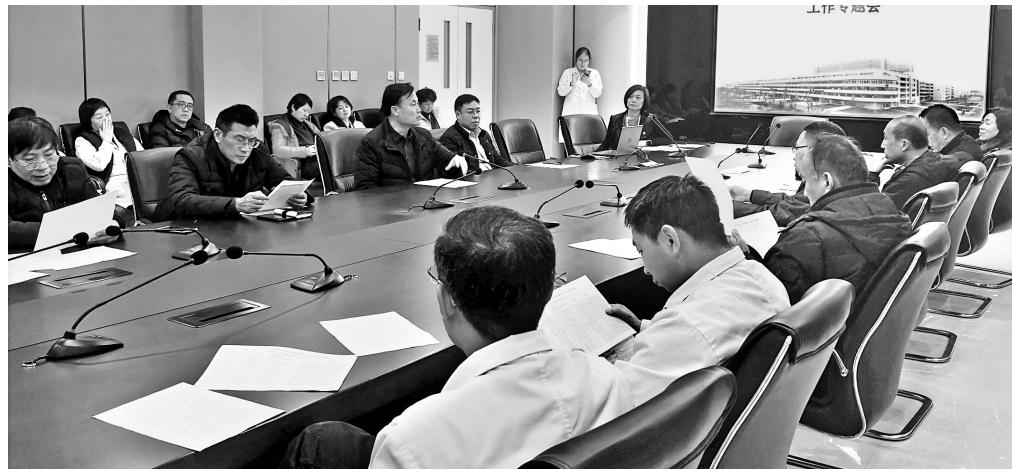
该院召开专题会议部署试点扩围工作(组图:医院供图)

作为医保支付标准;价格低于或等于中选价格的同通用名非中选药品,以实际价格作为支付标准;价格高于中选价格的同通用名非中选药品,其医保个人自付比例提高10个百分点(我省重特大疾病医疗保障特定药品除外),引导患者和医疗机构选用中选药品。2022年前价格高于中选价格的同通用名非中选药品全部调整到以中选价格为支付标准。