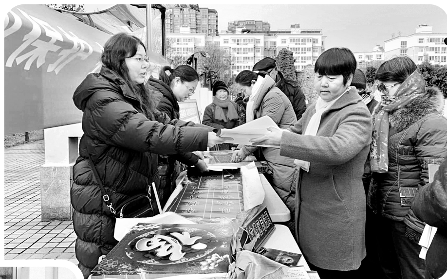
图为活动现场。

12月27日下午,文峰区司法局、永明路街道办事处、永明路司法所和天然律师事务所安泰苑社区开展法治宣传活动,对与群众生产、生活密切相关的法律法规进行宣讲,进一步增强了社区居民的安全意识、法律意识和法治观念。