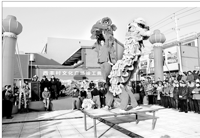
载歌载舞庆村文化广场建成

在工作中,我经常反思我做了什么、我做好了什么、我成了什么,坚持用社会反响好、党员认同好、自我感觉好、领导评价好的“四好”标准检验我的工作成效。