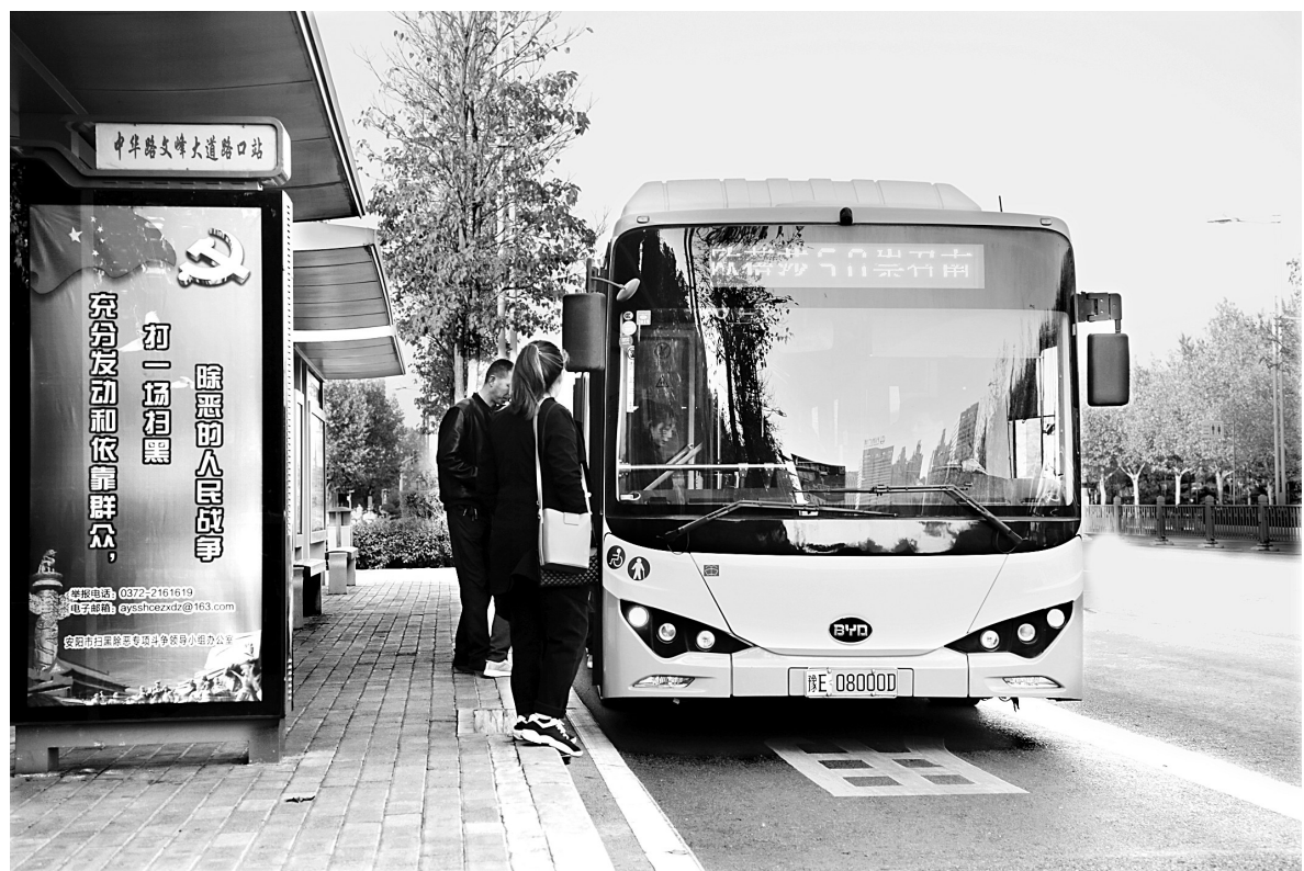
公交车规范进站

采访中,众多网友表示,随着城市公交网络越织越密,车厢里文明礼让、暖心服务随处可见,流动的公交车传递着城市的温度。