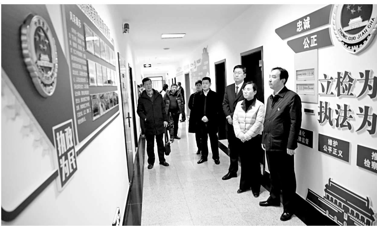
→12月6日下午,安阳县人民检察院举办“向人民报告”检察开放日活动,邀请部分人大代表、政协委员和群众代表走进该院,实地参观了12309检察服务中心、案件管理中心、人大代表联络站、政协委员之家、群众来信处理中心、远程视频庭审、社区矫正远程监督平台等场所,全方位了解检察职能,并对检察机关和检察工作提出意见和建议。

冬季雨雪天气多发,消防部门提醒广大司机朋友,车外有雾产生时车内也会产生雾气,因此最好开启玻璃除雾,后视镜除雾功能,并将出风口朝向挡风玻璃,降低车内雾气的产生。另外,司机朋友在出行前要做好车辆保养和检查,以防事故发生,当发生水温过高、爆胎、自燃等危险情况时,请迅速拨打119报警电话寻求帮助。