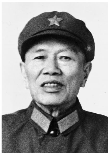
邓华像(资料照片)

全国抗日战争爆发后,邓华任八路军第115师685团政治处主任,参加平型关战斗。后任115师独立团政治委员、晋察冀军区第1分区政治委员、平西支队司令员兼政治委员,参与领导开辟平西抗日根据地。1938年5月任八路军第4纵队政治委员,与司令员宋时轮