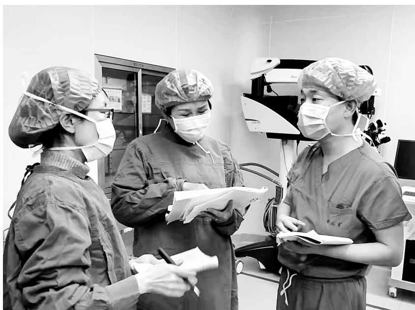
评审组专家现场查看手术室感控工作