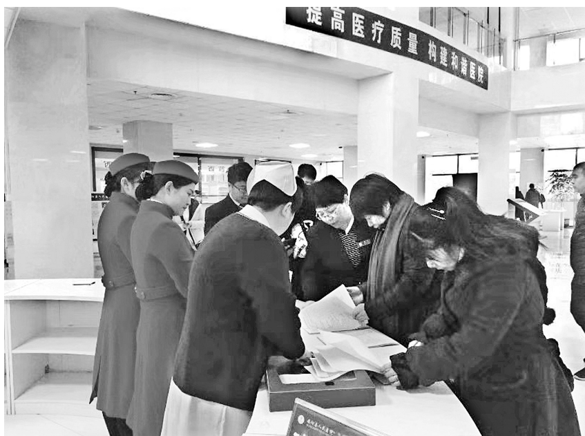
评审组专家现场查看门诊管理工作