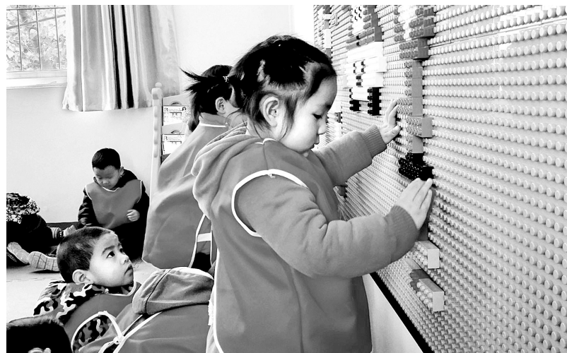
11月20日上午,韩陵镇文化站联合镇团委、金阳光礼仪之星幼儿园开展未成年人教育,组织80多名孩子在文化站开展趣味活动。图为孩子们在玩积木。

活动现场,白璧镇综治中心工作人员通过设立咨询台、宣传展板,面对面宣讲等方式,向群众深入宣传、细致讲解什么是平安建设、如何参与平安建设、扫黑除恶专项斗争的重要意义、怎样参与扫黑除恶专项斗争以及如何防范和抵制邪教等。活动现场,发放宣传品90余份,接受群众咨询30余人次,将扫黑除恶专项斗争根植于群众心底。