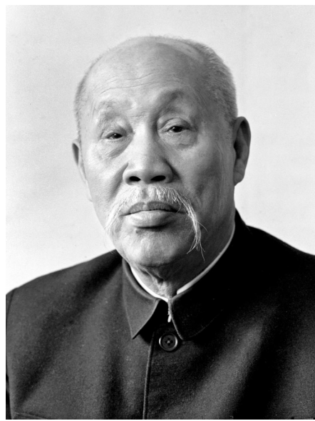
董必武像

1975年,董必武在北京逝世。叶剑英在追悼会上说:“董必武同志真正做到了一辈子做好事,不愧为无限忠诚于党和人民的无产阶级革命家!”