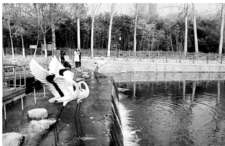
韩庄镇小河村地处汤河国家湿地公园腹地，自然环境优越。为大力发展乡村旅游，着力推进基础设施建设，11月23日，小河村在汤河沿岸安放了姿态各异的景观仙鹤，在竹林安放了憨态可掬的景观大熊猫，为村庄增添了新的活力。

农村人居环境整治工作要想做得好，需要示范引领、打造样板。今年年初以来，伏道镇围绕“党建引领、城镇提升、生态宜居、乡村振兴”的发展思路，以建设小游园、绘制文化墙为载体，坚持以文化人、以文育人，大力改善农村人居环境，快速推进功能完善、环境优美、特色鲜明、文明和谐的美丽新农村建设。截至目前，该镇建成生态小游园6个，绘制文化墙3万余平方米。同时，该镇紧盯示范村农村人居环境整治，大力推进绿化、亮化、美化等，打造了一批颜值高、气质佳的样板村，使乡村面貌焕然一新。