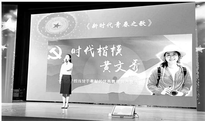
微型党课比赛现场

此次的参赛选手都来自基层一线，他们结合自己的工作性质，用生动的语言，富有激情地讲述了一个个感人的故事，并采用电子教学课件，实现