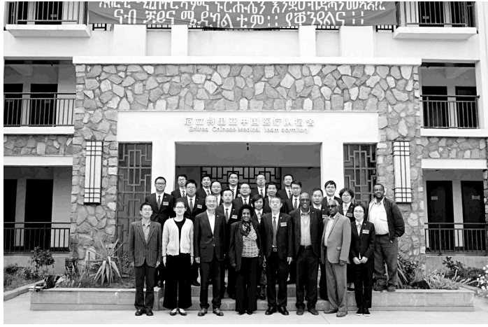
阿米娜和医疗队队员合影

10月11日15时许,厄立特里亚卫生部长阿米娜(Amina)应邀访问了中国援厄立特里亚第十三批医疗队驻地,带来了厄立特里亚卫生部对医疗队的诚挚问候和衷心感谢。