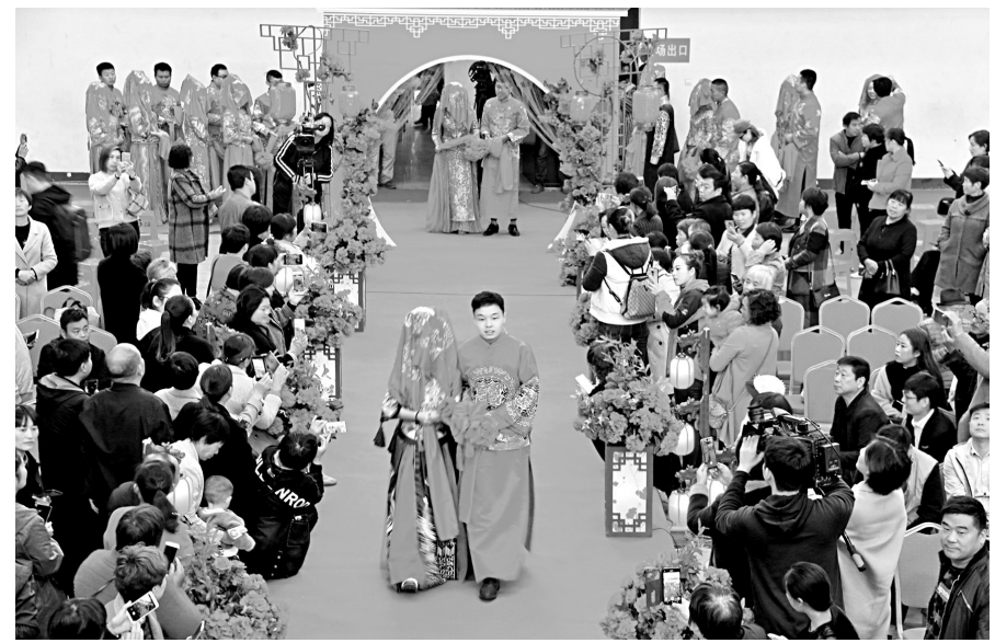
集体婚礼现场

本报讯(特约记者 徐淑霞)10月16日,滑县产业集聚区体育馆内,流锦溢彩,笙歌欢奏,20对新人集体婚礼在现场1000余人的见证下圆满礼成。