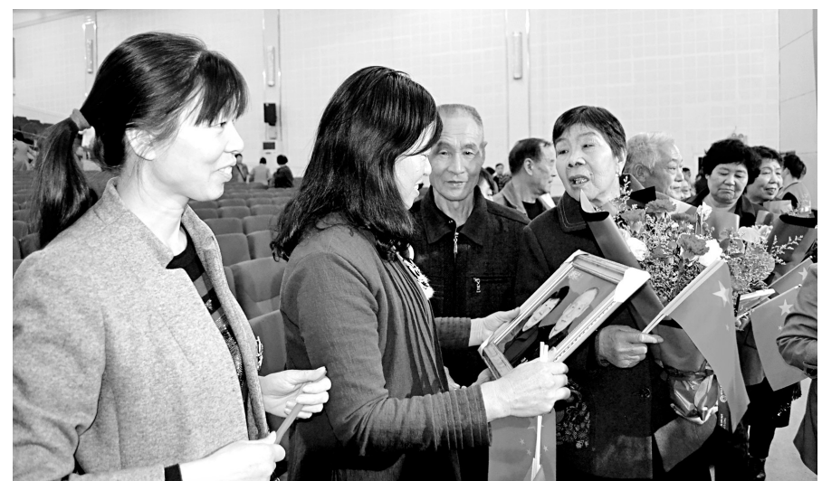
为弘扬孝老爱亲传统美德,营造浓厚的“孝老爱亲·向上向善”的社会氛围。10月13日晚,滑县县委宣传部、滑县老龄委等单位举行庆祝中华人民共和国成立70周年“爱老月”文艺晚会,隆重表彰全县10对金婚老人和8名孝老敬老之星模范人物。因为受到表彰的金婚老人高兴地欣赏滑县老龄委赠送的金婚纪念照。