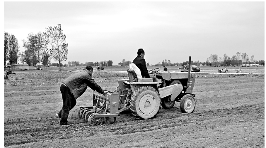
当前正值秋种期,在滑县农村广袤的大地,到处呈现一派小麦播种的繁忙景象。图为10月15日,王庄镇后王庄村农民正在田间播种。