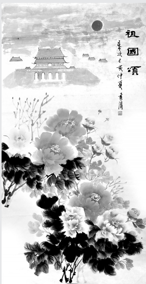
祖国颂(国画) (李秀清作)