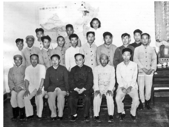
图为郭沫若来安期间合影。前排右三为郭沫若,左二为曹力仁,左三为刘东升,右二为李绪三,右一为安华,第二排右七为魏民。

郭老一到安阳,不顾正下着毛毛细雨,就直奔殷墟“殉葬坑”。郭老和省、市领导一边观看实物,一边听取中科院考古研究所专家的介绍。郭老脸色很凝重,观察得非常仔细,不时和身边的省、市领导以及考古研究所的同志交谈。郭老高度评价了安阳殷墟的各项重大发现,还专门指出:“殉葬坑”是新中国成立后的又一重大发现。一个多小时后,郭老才到小屯和王裕口稍事休息。李绪三向郭老介绍