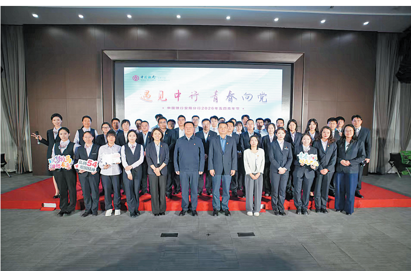
活动现场

片,展现了积极向上的精神风貌。在“青春·对话”微论坛上,基层管理者聚焦青年成长、职业压力、工作与生活平衡等热点话题,与青年员工面对面交流、答疑解惑,传递组织关怀与成长经验。