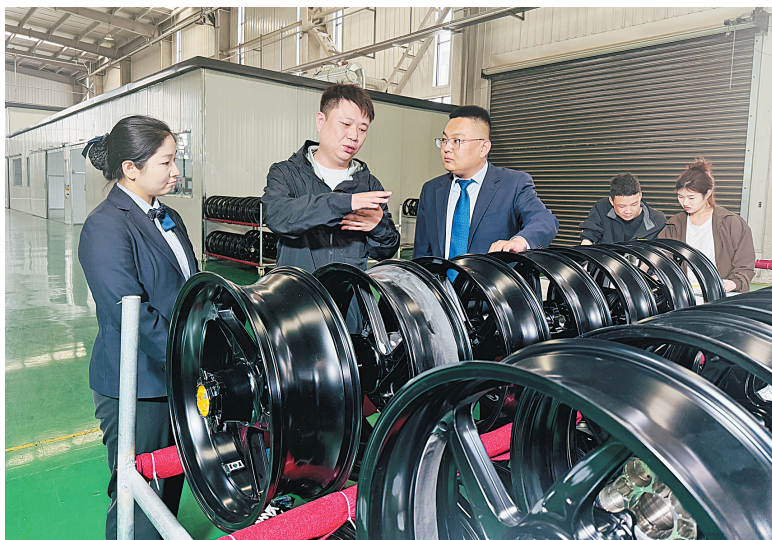
河南农商银行内黄支行工作人员深入企业了解情况

4月30日,记者来到安阳固特隆采访。在智能化生产车间,全自动智能锻造生产线高速运转,机械臂精准完成加工转运,智能设备实时检测产品精度,中控系统同步汇总生产数据,全流程智能化生产尽显企业硬核制造实力。自2023年落户内黄县先进制造业开发区以来,企业在短短两年内建成了完整的智能锻造产业链,产品采用高端铝合金材质,强度、轻量化指标均优于传统产品,多项性能领跑国际同行,产品成功进入国际知名车企供应链,远销海外多国。随着赛事热