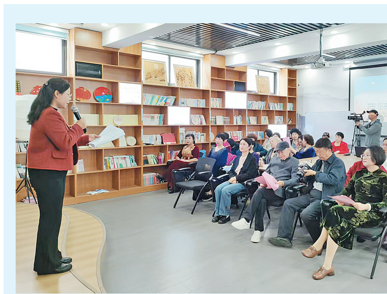
4月16日,在滑县老店镇河东村,一位白发老太太被儿孙包围着,幸福而感人。

此外,滑县人大常委会还将深化推广“一月一主题”代表履职活动,每月对上月民情办理情况进行通报,并围绕当月主题开展调解纠纷、专题走访、政策宣讲等行动,推动群众身边“小事”“急事”早发现、早解决。