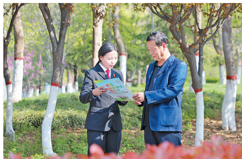
近日,汤阴县人民法院干警走进城南公园开展普法宣传活动。他们围绕网络安全、反电信诈骗等贴近生活的议题,结合真实案例“以案释法”,引导群众学法、懂法、守法、用法。

据了解,自2024年11月首次公开宣判此类案件以来,该院已敲响“三炮”,形成持续高压震慑。“公开宣判+法治教育”已从创新举措固化为可复制推广的长效机制,形成护法股商“123工作法”。下一步,该院将依托“文保法官工作室”,以法治守护殷商文明,推动司法护遗经验从“殷墟”走向“四方”。