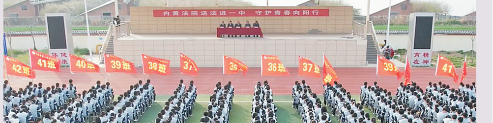
4月2日,内黄县人民法院干警走进内黄县第一中学开展普法宣传。