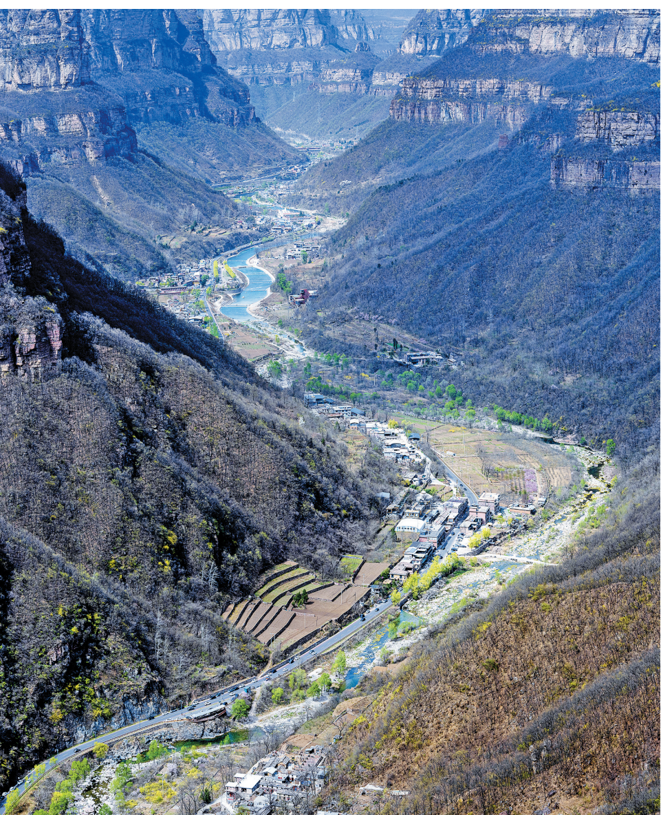
4月4日,林州太行大峡谷春意浓浓,车流如织。