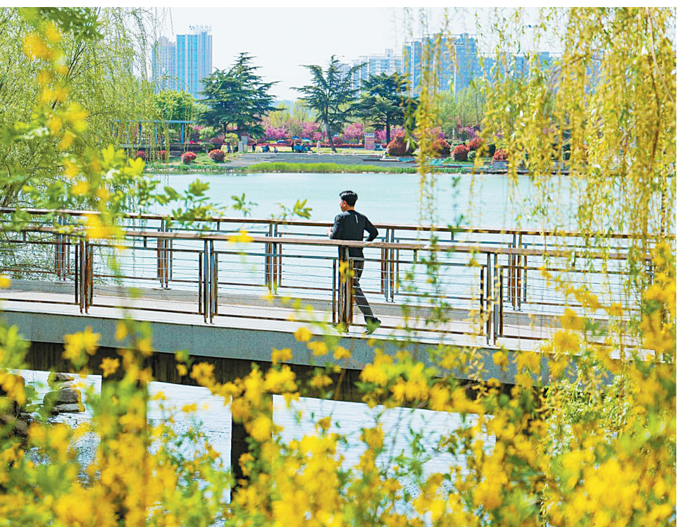
4月3日,市民在CBD公园跑步。