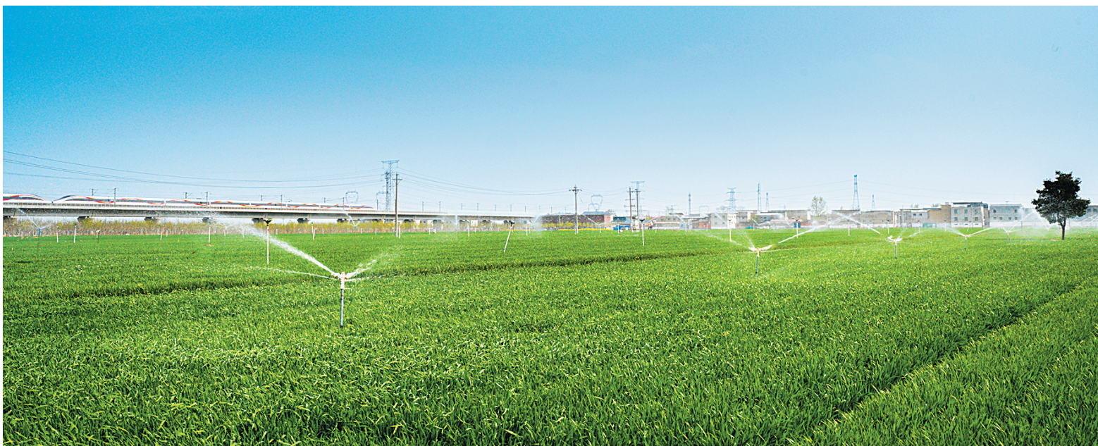
4月3日,安阳县高庄镇大官庄村,麦苗长势喜人。