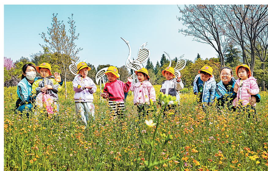
4月2日,幼儿园的小朋友在易园游玩,欣赏春色。