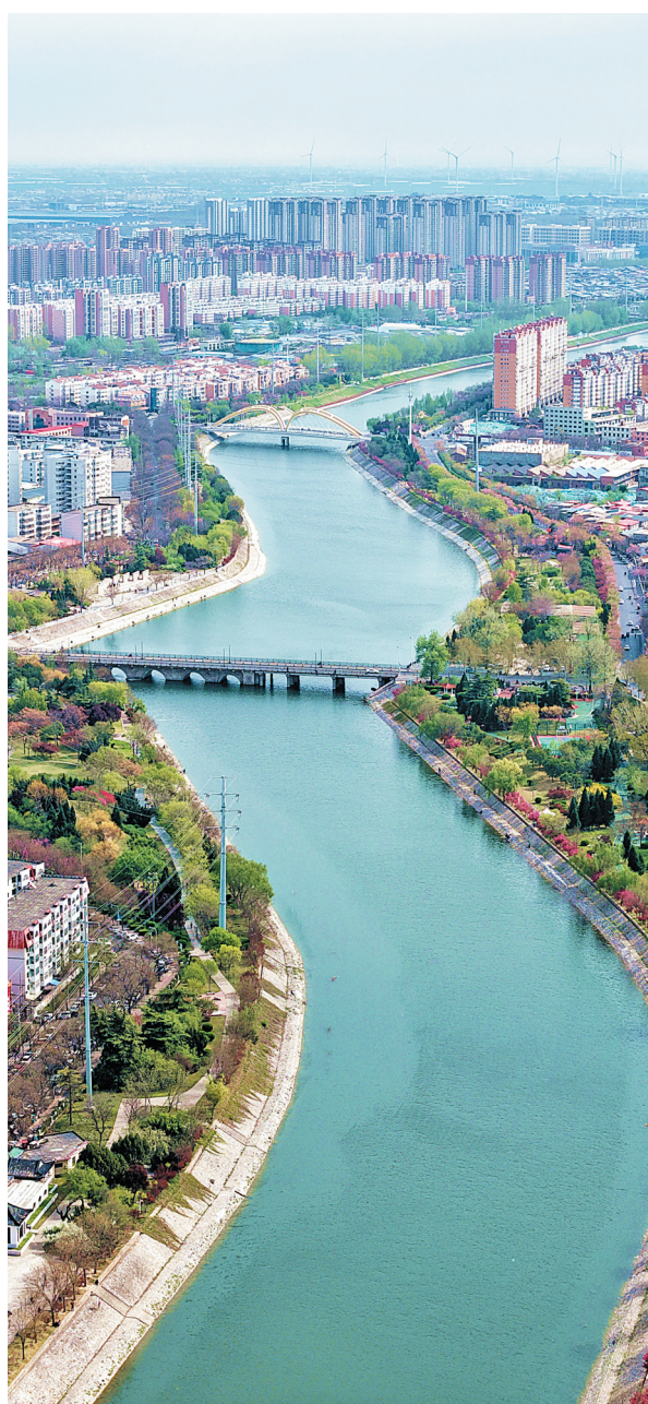
4月3日,洹河两岸春光无限。