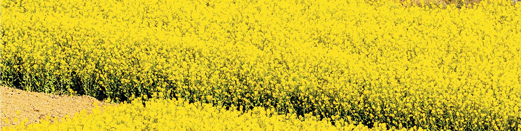
4月6日,林州市东姚镇万亩油菜花海花开正浓,农民在田间耕作。