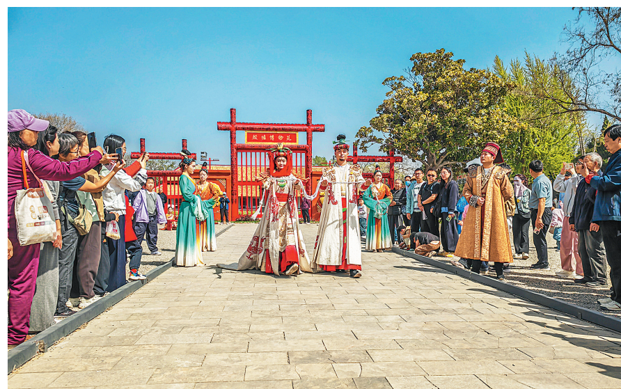
4月5日,殷墟宫殿宗庙遗址,精彩表演引得游人驻足围观。