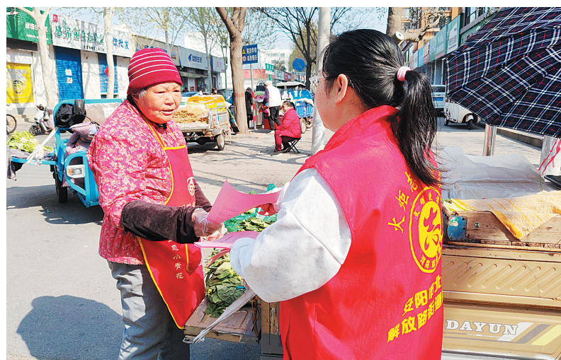
4月1日,解放路街道洹园南社区组织志愿者,在辖区开展“我们的节日·清明”主题宣传活动。此次活动有效引导辖区群众树立绿色、文明、安全的祭扫观念,为打造文明、和谐、宜居的社区环境奠定了坚实基础。

此次下水道疏通工作,快速解决了群众的“急难愁盼”,进一步拉近了社区与居民的距离,用实际行动践行了为民服务的初心使命,赢得了辖区居民的一致认可。