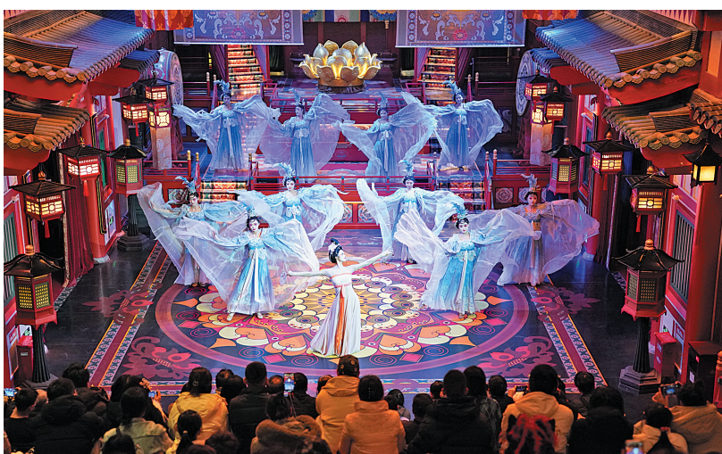
演员在西安长安十二时辰主题街区表演大唐乐舞《霓裳羽衣舞》

春日经济“热气腾腾”,国潮消费持续升温。“十五五”规划纲要提出,推动老字号、国货潮牌做精做强。将古韵国风融入时尚潮流,对传统文化作出创新表达——国潮,正融入当代美好生活,编织人文与经济共生共促的动人图景。