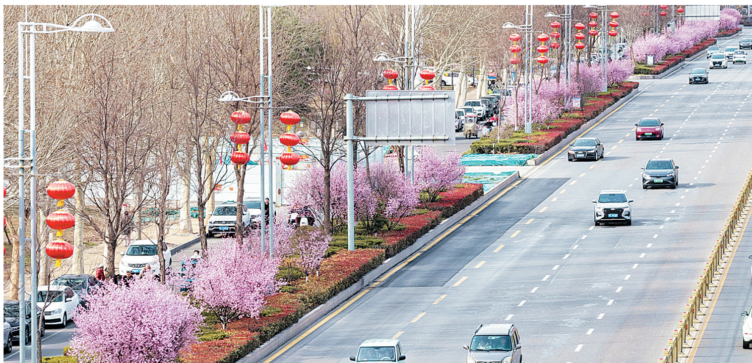
花开长街, 与春同行