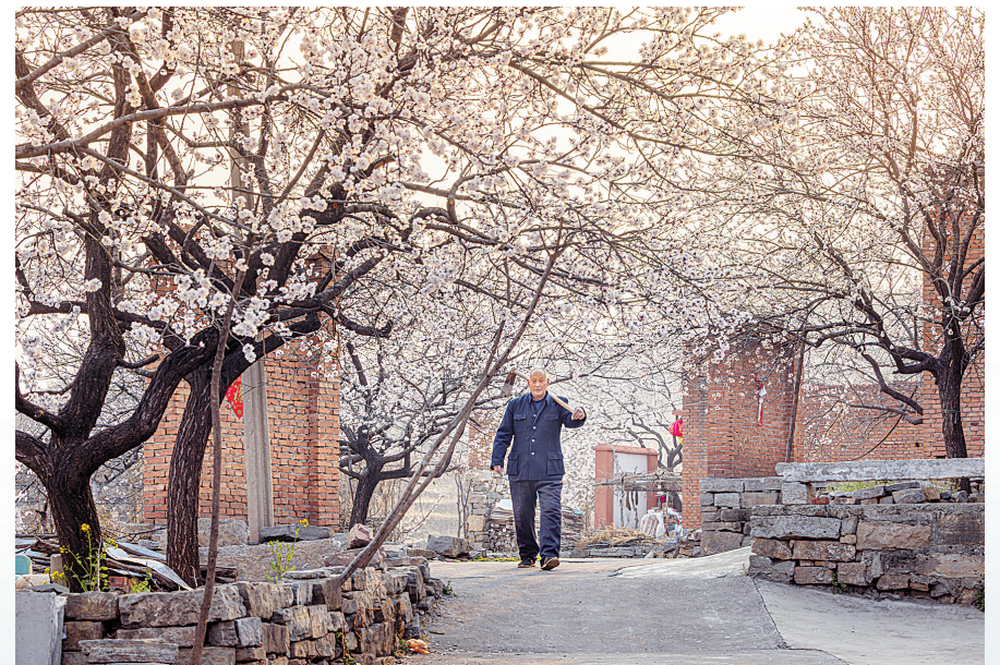
房前屋后, 花满枝头