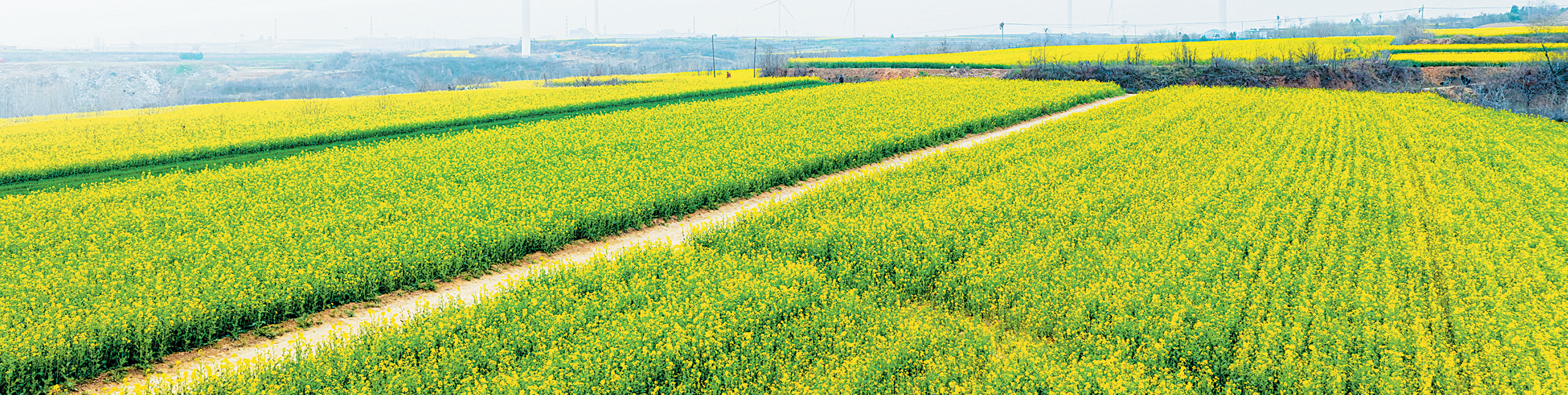
油菜花开, 一坡金黄