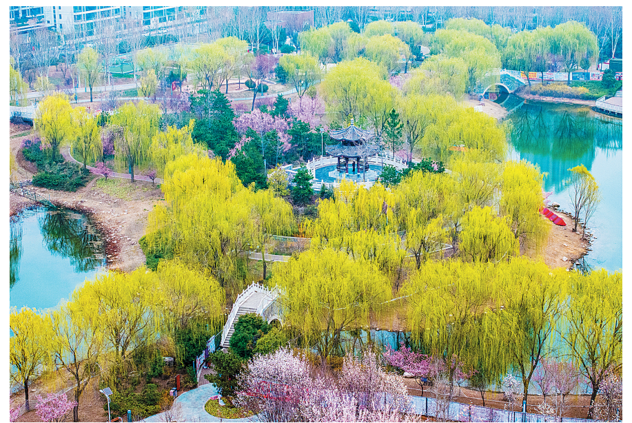
花红柳绿, 满园春景

安阳的春天, 既有自然馈赠的诗意浪漫, 亦有生生不息的城市脉动, 在花影与生机间, 书写着属于这座古都的春日序章。