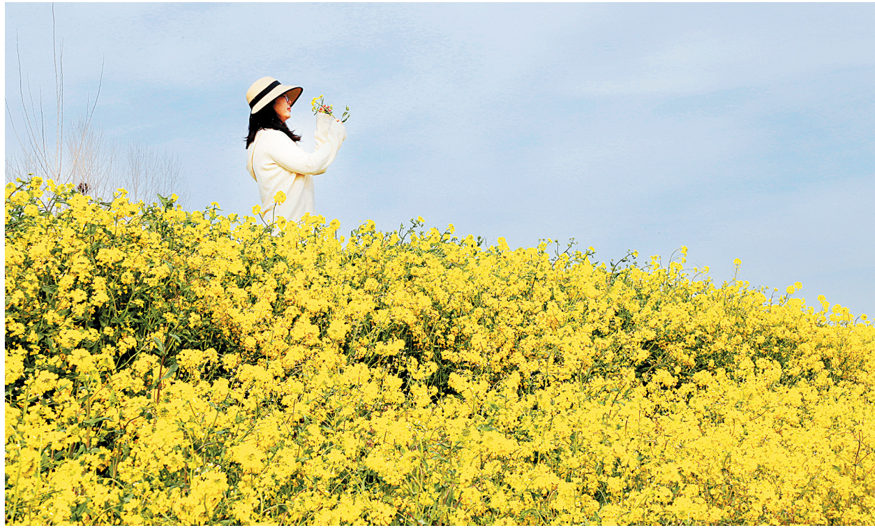
花田一隅, 恰好遇你