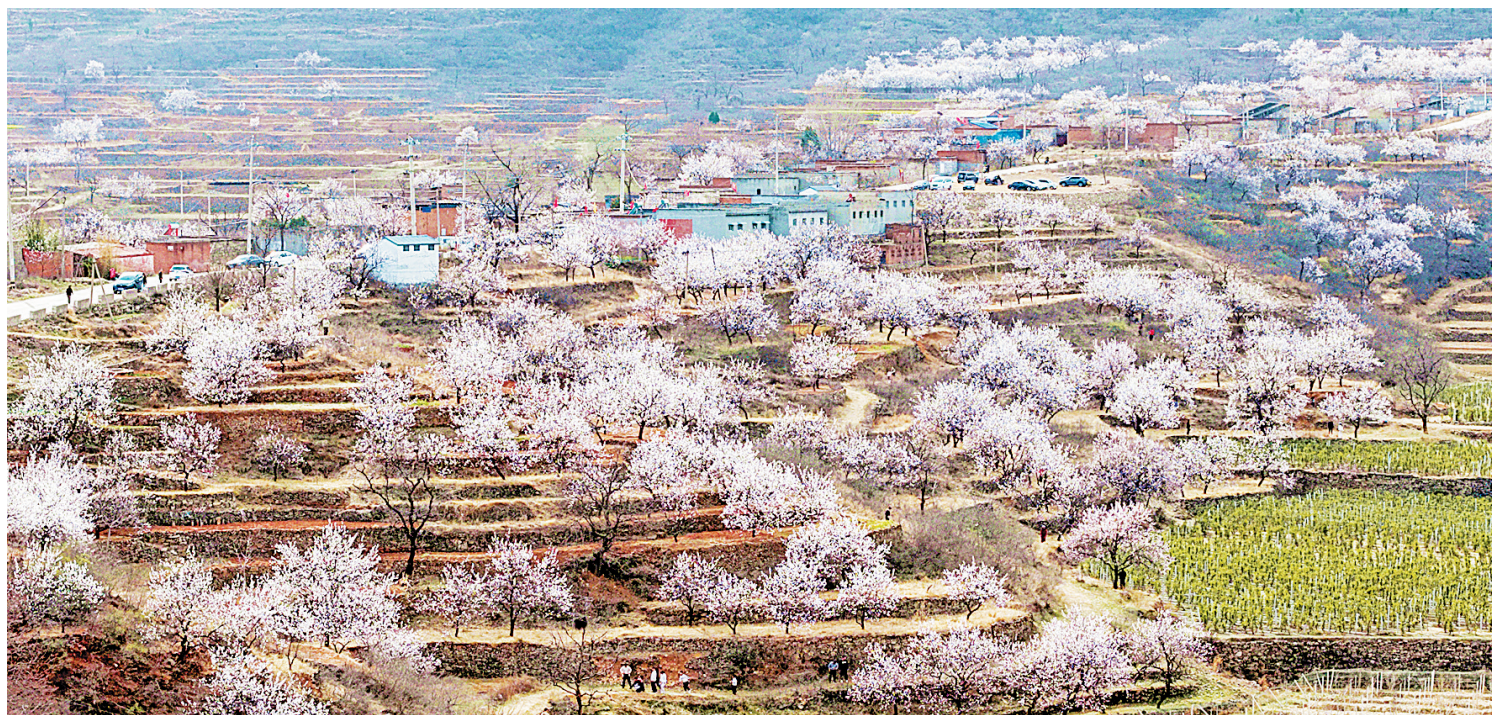
山村梯田, 粉白相间