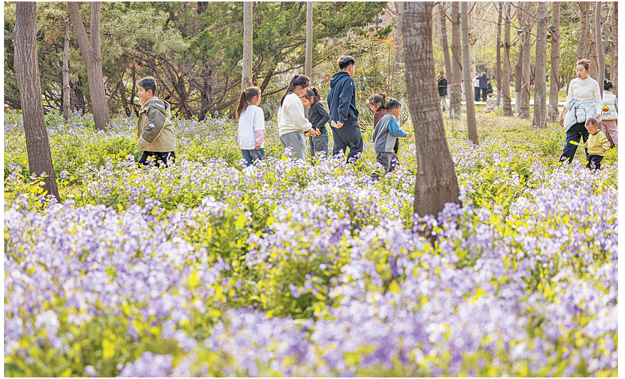
花开人间, 踏春易园