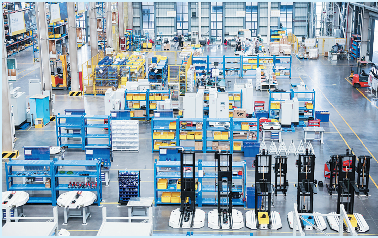
这是位于嘉兴市南湖区嘉兴科技城的浙江一家科技集团股份有 限公司的智能物流机器人装配和检测车间