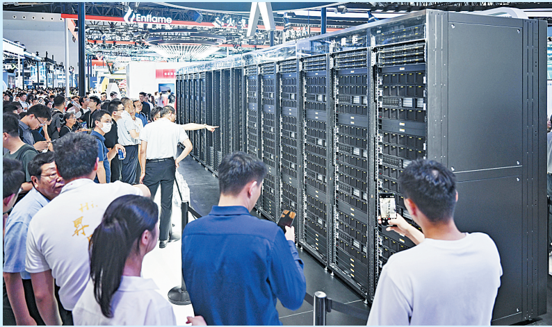
2025年7月27日,参观者在上海举行的2025世界人工智能大会展览现场华为展区参观昇腾384超节点