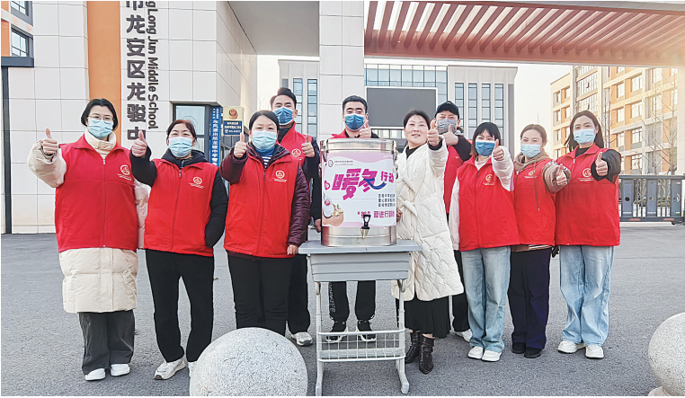
志愿者熬好姜茶等待送给家长

姜茶,递到一位等候的家长手中。一次性纸杯传来温热的触感,白气氤氲而上。那位家长先是微微一怔,随即笑意漾开,连声道谢。这样的场景,在校门口不断重复着。