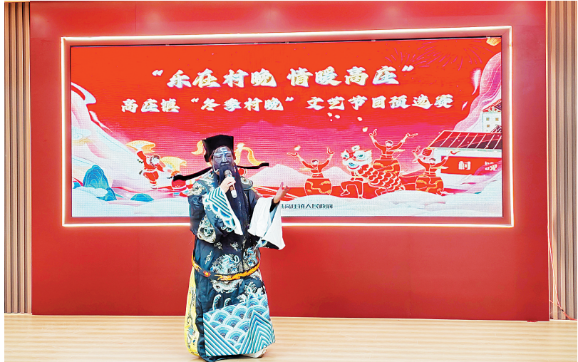
演出人员表演戏曲节目

此次交流会既分享了可复制、可推广的育人“金点子”,又凝聚了班主任队伍的工作合力。参会班主任纷纷表示,把学到的经验转化为教学实践,深耕乡村教育沃土,用心呵护每一位学生,让乡村娃在优质教育滋养下向阳生长,奔赴美好未来。