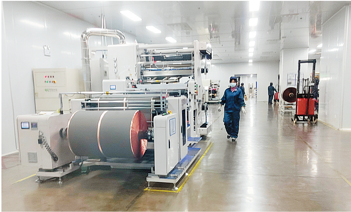
工人正在车间内忙碌

在明亮的智能车间,一台台机器发出低沉的轰鸣声,身着统一工装的工人在一旁查看着机器设备的运行状况。墙体上的“负极分切/辊分”标识牌表明,这里的生产属于电极段的工艺程序之一。“这台机器是轧辊机,它可以把原材料迅速分条。电池的正负极的作业程序都是在这里完成的,它可