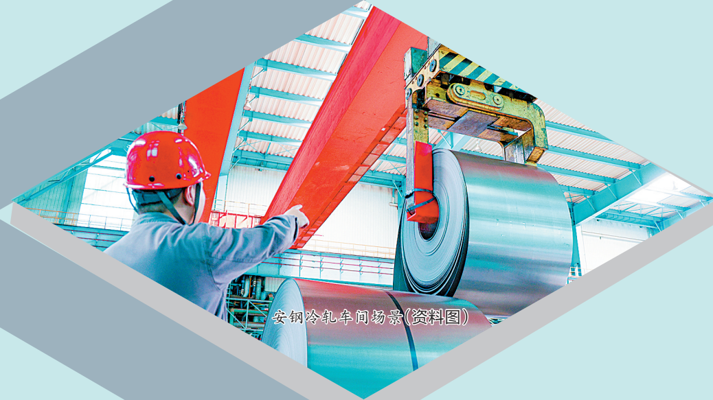
安阳冷轧车间轧钢(资料图)

★ 建设现代化产业体系 ★ 一体推进教育科技人才发展 ★ 因地制宜发展新质生产力 ★ 融入服务全国统一大市场建设 ★ 深化产业园区改革发展 ★ 推动金融高质量发展 ★ 构建现代化基础设施体系 ★ 推动内外贸一体化发展 ★ 扎实推进乡村全面振兴 ★ 推进区域协调发展和新型城镇化 ★ 把文旅产业培育成为支柱产业 ★ 着力保障和改善民生 ★ 推动绿色低碳转型和生态保护治理 ★ 推进党建引领基层治理效能治理和加强社会治理 ★ 提高防范化解重点领域风险能力