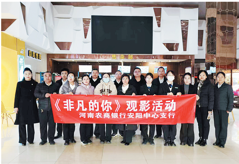
12月8日，河南农商银行安阳中心支行在横店电影城（华强店）组织开展《非凡的你》观影活动，60余名员工集体观看。

安阳金融监管支局相关负责人表示，下一步，该支局将继续锚定“五型”支局建设目标，持续深化“四新”工程实践，不断开创县域金融监管工作新局面。