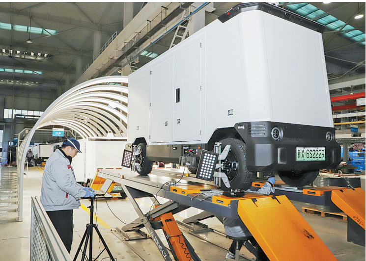
11月25日,位于安阳县高庄镇智能制造园区的新石器智邺(安阳)智能科技有限公司的工作人员正在对无人车进行调试。