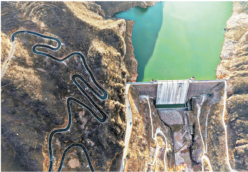
12月7日,林州市马家岩水库与新铺设的山村公路构成了一幅美丽画卷。