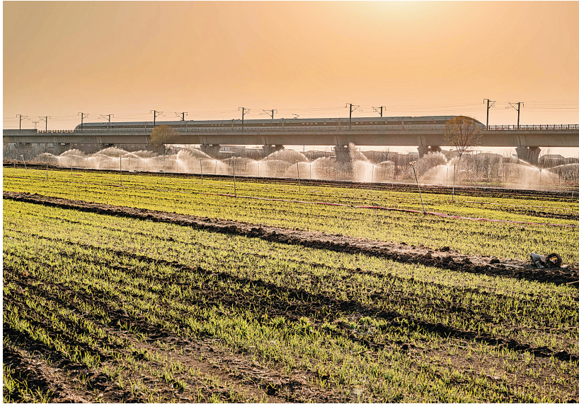
12月7日,在安阳县高庄镇东小庄村,麦田“喝”上了封冻水。