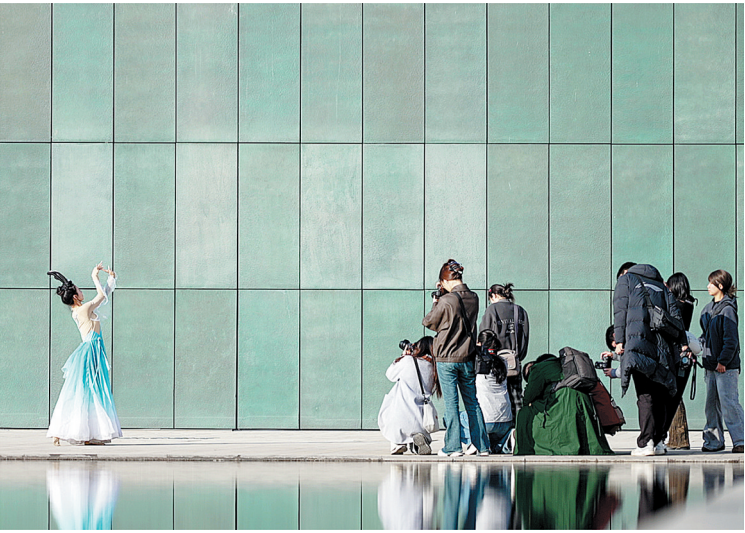
12月7日,我市摄影爱好者在殷墟博物馆拍摄人像,定格水影间的古典韵律。