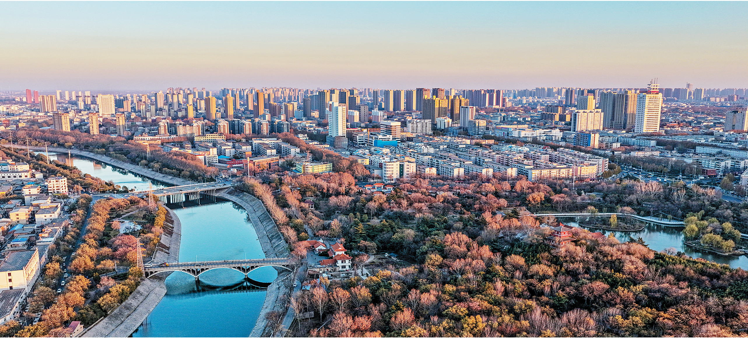
12月3日,冬日暖阳里,远处的高楼与安阳河交相辉映,既见古都生态之美,也藏着洹水孕育殷商文明的悠悠底蕴。