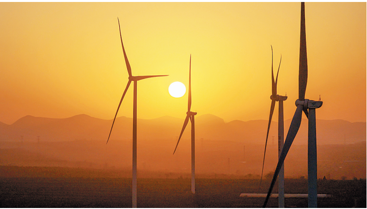
12月3日,在龙安区马投涧镇,风力发电机叶片与落日同框。