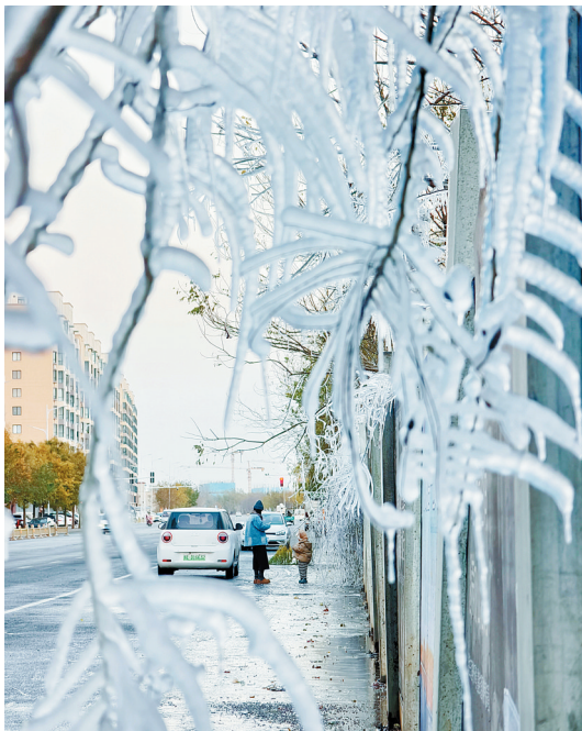
12月3日,在安居苑小区南门附近,街道旁的树枝上挂满了冰凌。