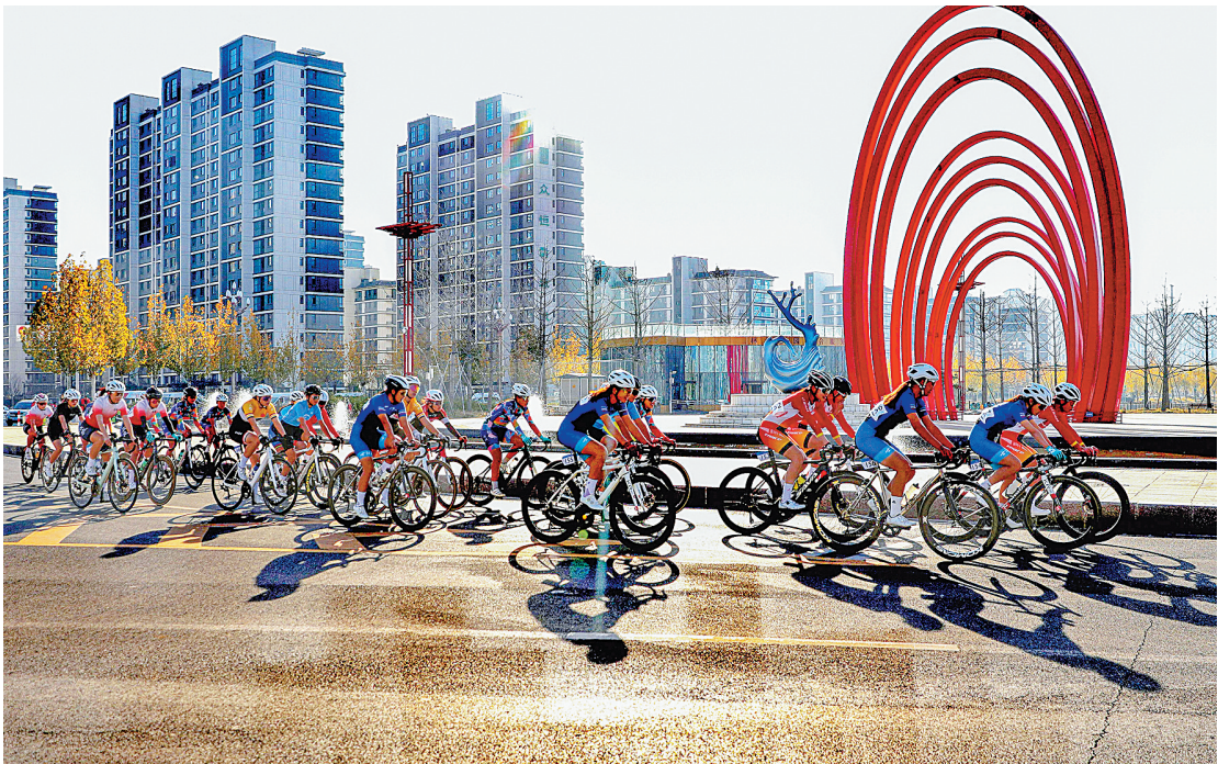
11月26日至30日,2025年河南省青少年公路自行车锦标赛在林州市林河公园举行。