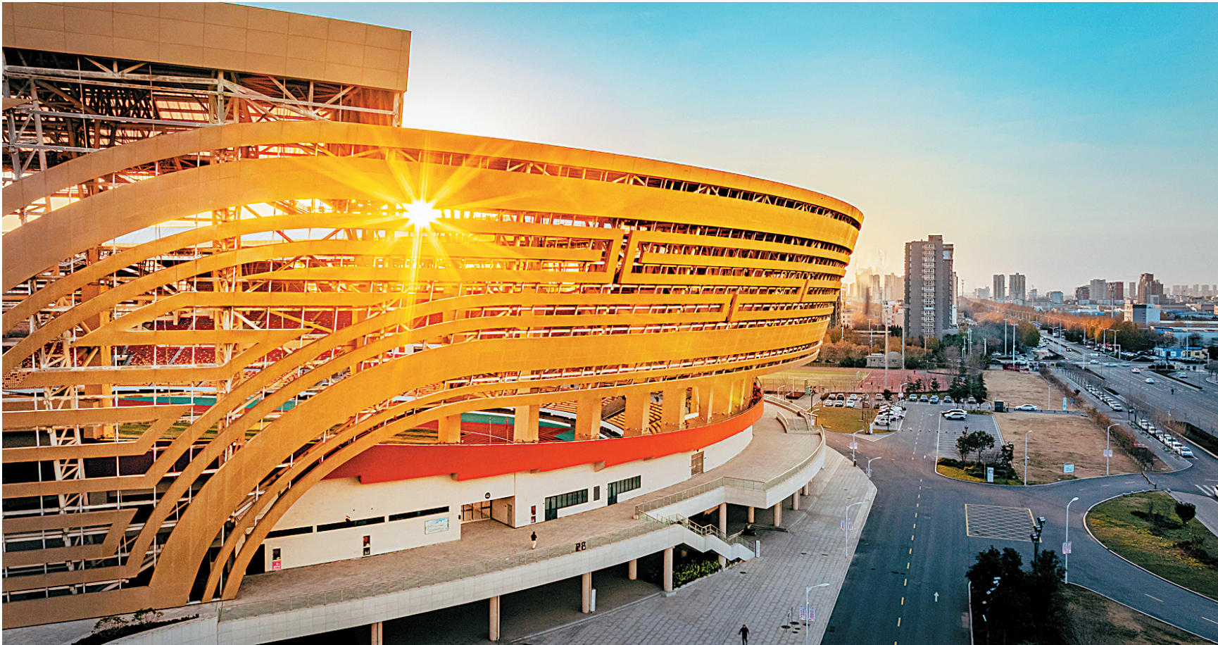
12月2日,金色的暖阳从市文体中心体育场建筑的钢结构缝隙中穿过,独特的视觉效果令人陶醉。