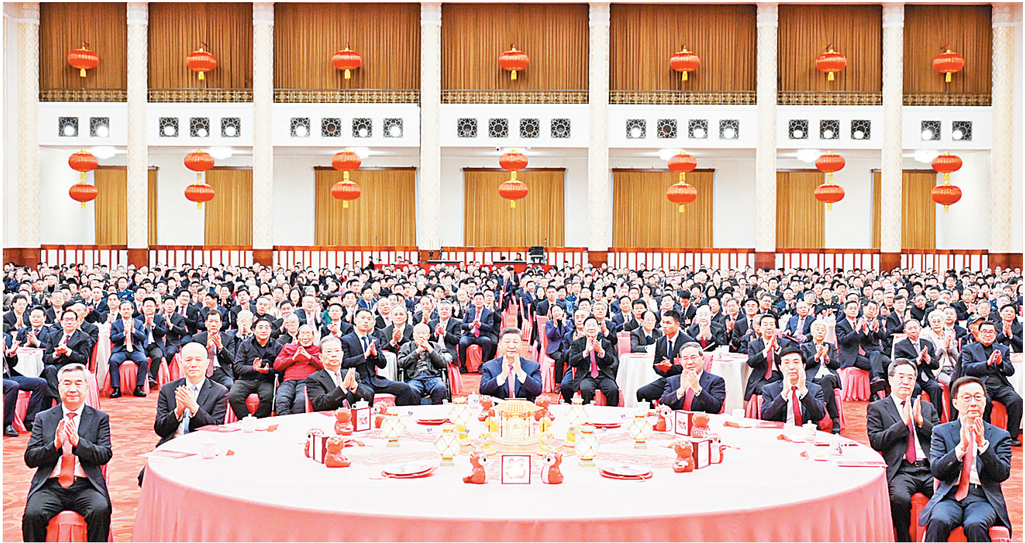
1月27日,中共中央、国务院在北京人民大会堂举行2025年春节团拜会。党和国家领导人习近平、李强、赵乐际、王沪宁、蔡奇、丁薛祥、李希、韩正等同首都各界人士欢聚一堂、共迎佳节。

新华社北京1月27日电 中共中央、国务院27日上午在人民大会堂举行2025年春节团拜会。中共中央总书记、国家主席、中央军委主席习近平发表讲话,代表党中央和国务院,向全国各族人民,向香港特别行政区同胞、澳门特别行政区同胞、台湾同胞和海外侨胞拜年。 习近平强调,即将过去的甲辰龙年,是我们振奋龙马精神、历经风雨彩虹的一年。一年来,面对复杂严峻形势,我们沉着应变、综合施策,攻坚克难、砥砺前行,中国式现代化迈出新的坚实步伐。 李强主持团拜会,赵乐际、王沪宁、蔡奇、丁薛祥、李希、韩正等出席。 人民大会堂宴会厅灯光璀璨、暖意融融,各界人士2000多人欢聚一堂、共迎佳节,现场洋溢着欢乐祥和的节日气氛。