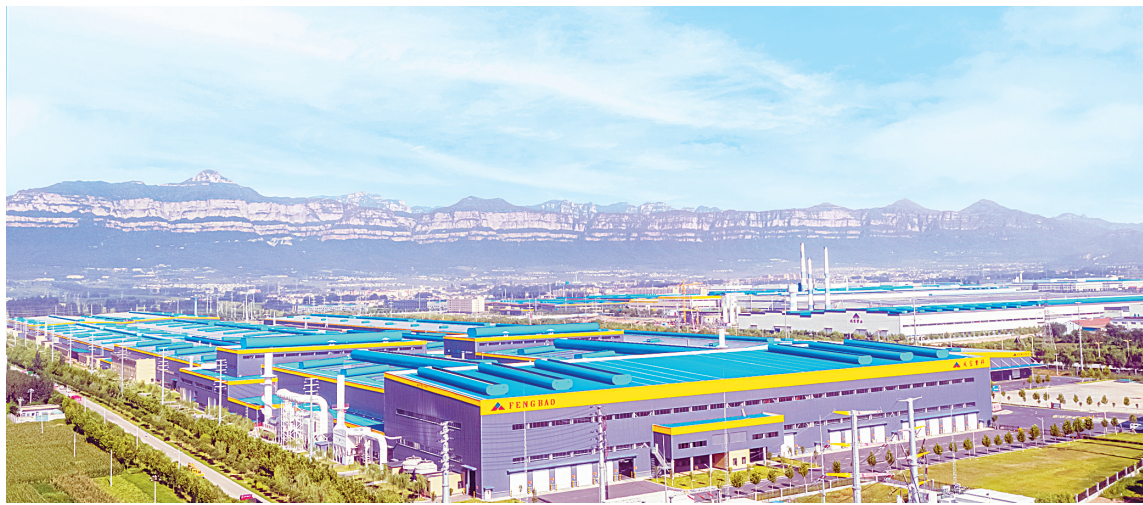
位于红旗渠经济技术开发区的凤宝特钢集团外景(资料图)

一年春作首,万事行为先。走进国家级经济技术开发区——红旗渠经济技术开发区园区内,除感受到日渐升高的气温外,更有一股干事创业、蓬勃发展的“热度”。致远二期、辉轮科技、嘉隆新材料、新东方合耀等项目正加班加点抢抓施工进度。这股“热度”源于红旗渠经开区改革的深度和创新的力度。