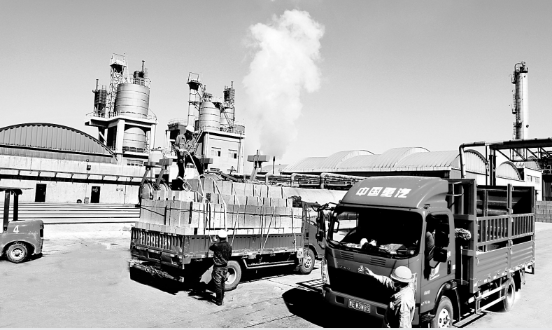
安化建材厂砌块砖销售现场

“安全是我们的底线,在确保安全生产的基础上,改变经营理念才能给我们带来更大的效益。”该厂负责人向记者介绍,“我们以全面推行成本预算管理为载体,细化目标考核办法,完善内部考核体系,做到目标量化、考核真实、奖优罚劣,并积极开拓